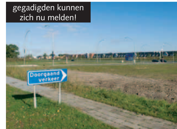
gegadigden kunnen zich nu melden!

Eekwal 20 8011 LD Zwolle T: +31 (0)38 425 44 85 F: +31 (0)38 425 44 86 W: www.03projectontwikkelaar.nl E: info@03projectontwikkelaar.nl