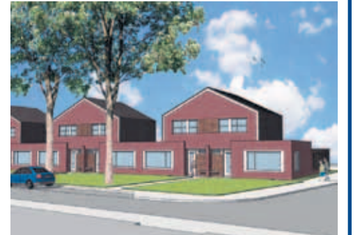
Patio-woningen aan de Campherbeeklaan