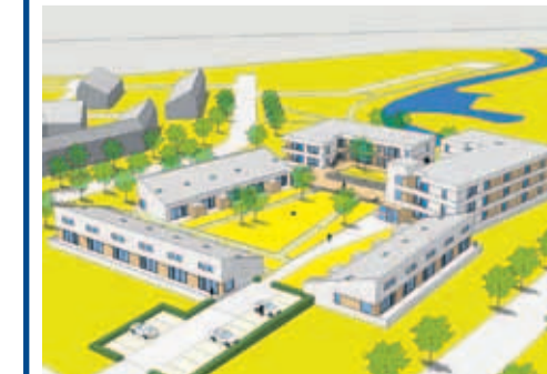
ontwerp woningen Juliana van Stolberg.