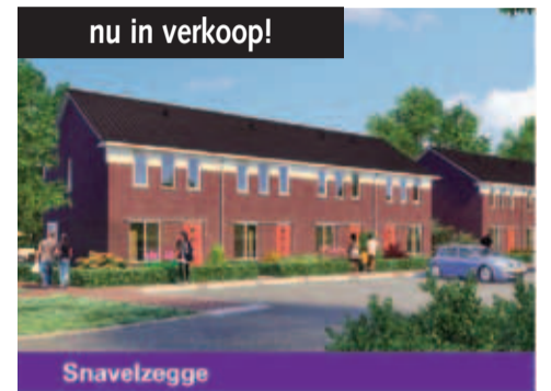
Snavelzegge sen 10.00 en 14.00 uur van harte welkom in restaurant Luning in Ruinen voor meer informatie over de woningen en kavels van 'De nieuwe Heerlijkheid'.

Onder de grondgebonden woningen zijn zestien twee-onder-een-kapwoningen in twee basistypes en acht rijwoningen. De woningen worden uitgevoerd in een typische jaren '30-stijl met een inhoud variërend van 382 tot 603 kubieke meter. Geïnteresseerden zijn zaterdag 14 mei tus-