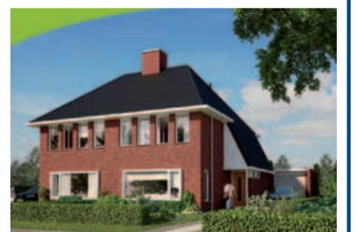
de reeds gerealiseerde twee-onder-eenkapwoning.