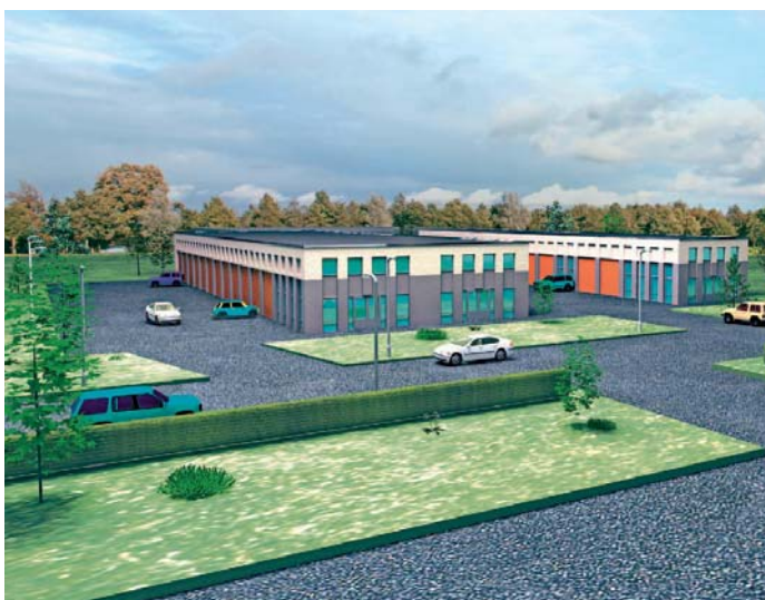
3D impressie van het unieke bedrijvencomplex op Marslanden G, Zwolle

In Zwolle blijkt veel animo te zijn voor goedkope flexibele opslagruimten voor bedrijven. 03 Projectontwikkeling speelt daar op in met opslagunits die ook uitermate geschikt zijn voor stalling en lichte industrie. René Kroes: 'Zo kunnen de units dé oplossing zijn voor een winkelier die opslagruimte zoekt, de autoverzamelaar die zijn collectie wil stallen of bijvoorbeeld de schilder die een werkplaats nodig heeft. Het is zelfs mogelijk om de unit in te richten met een kantoortje.'